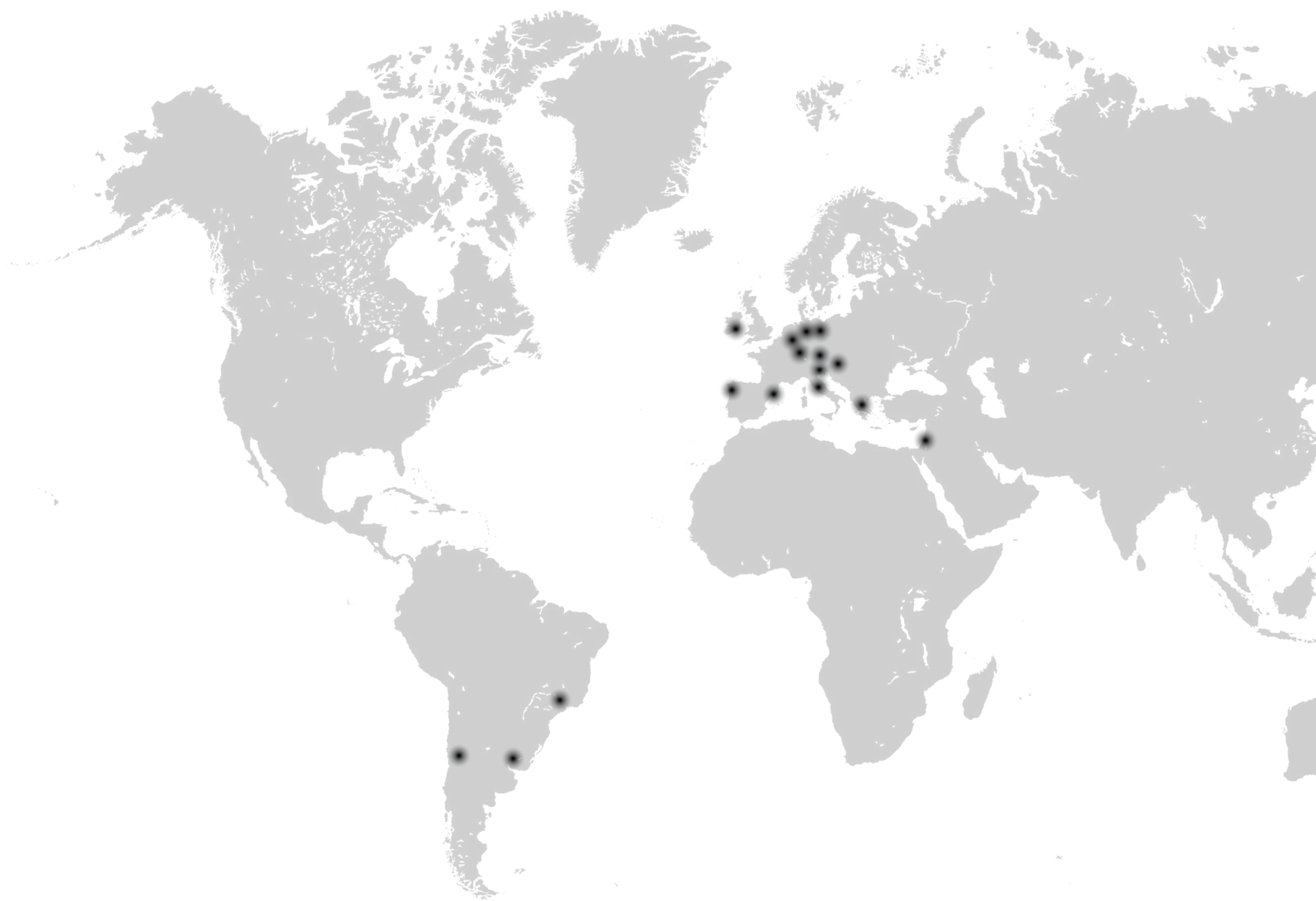
Figure 1. Distribution of Chamaechaerophyllum in the Mediterranean region and South America. The dots represent the locations of the studied populations.